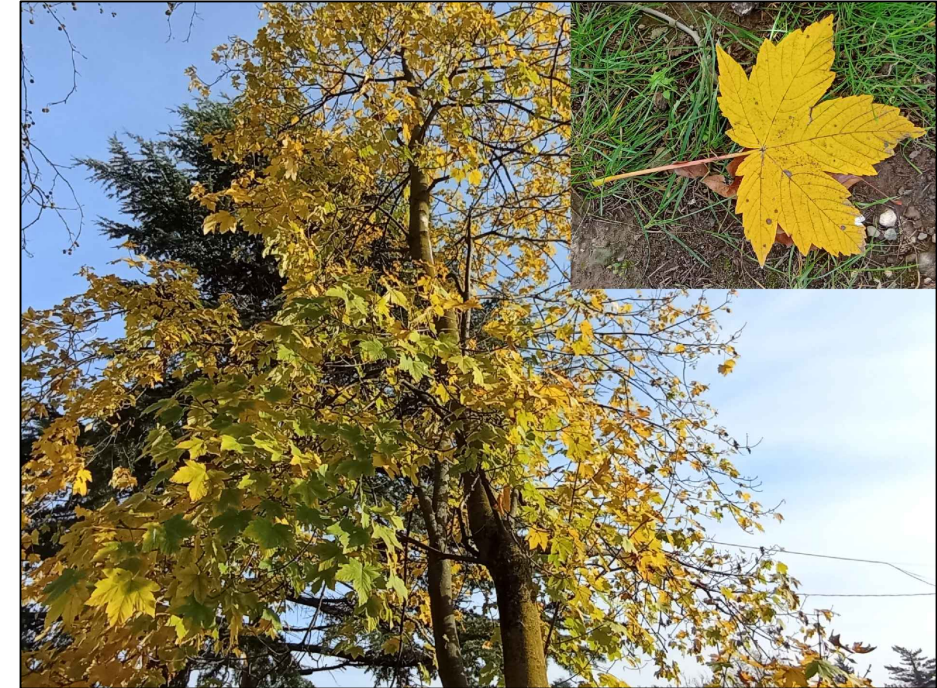
Acer di monte