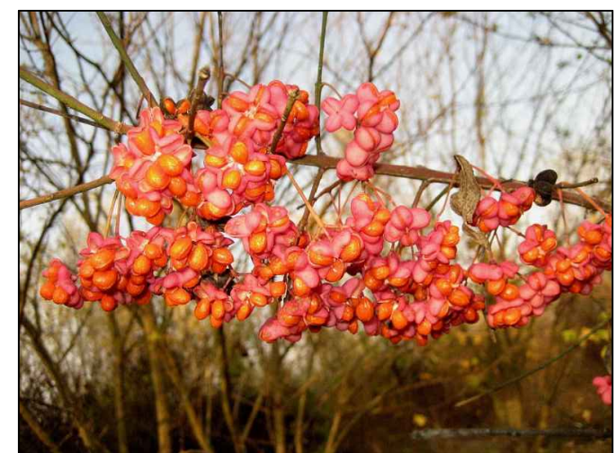
Berretto del prete