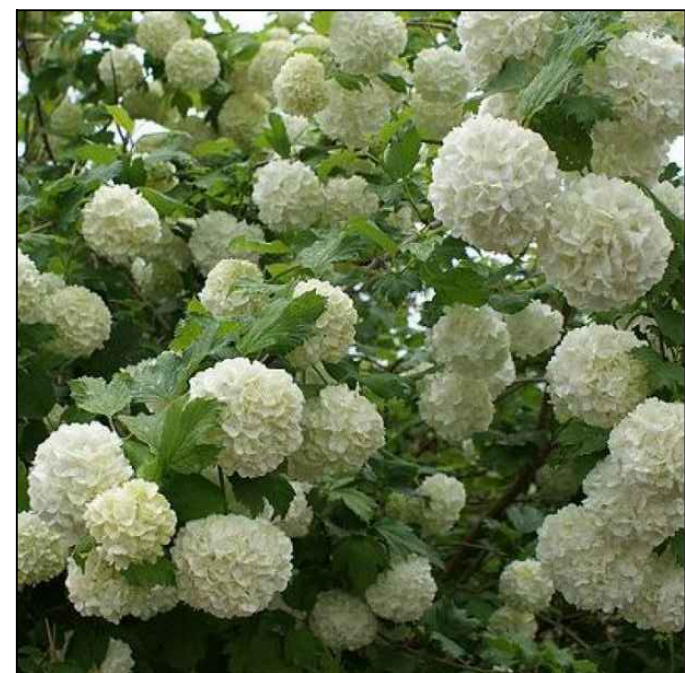
Palla di neve