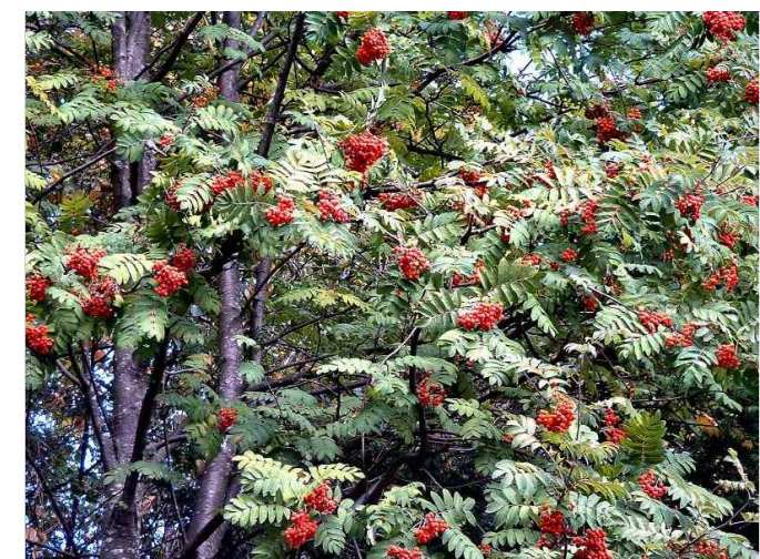
Sorbo degli uccellatori